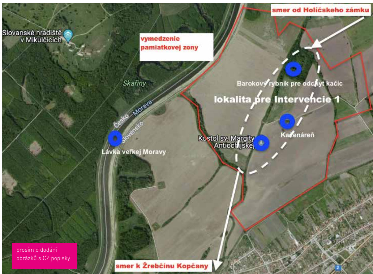
Vyznačení NKP a památkové zóny převážně pro Intervence 1